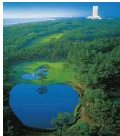
フェニックスカントリークラブ▲